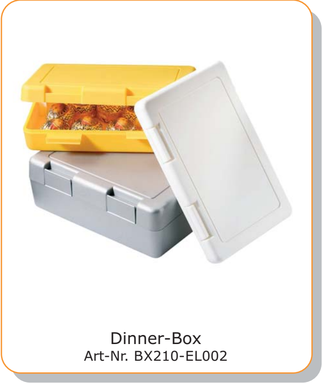
Dinner-Box Art-Nr. BX210-EL002