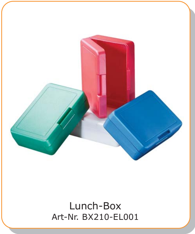
Lunch-Box Art-Nr. BX210-EL001