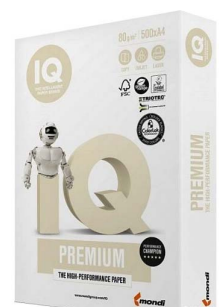
IQ Premium Art-Nr. KP012-40800