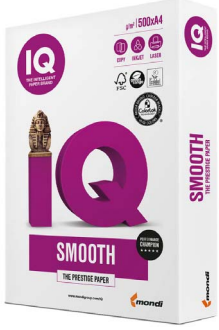
IQ Selection Smooth Art-Nr. KP009-40800