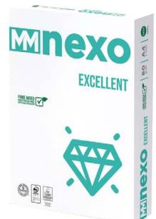
NEXO Excellent Art-Nr. KP010-40800