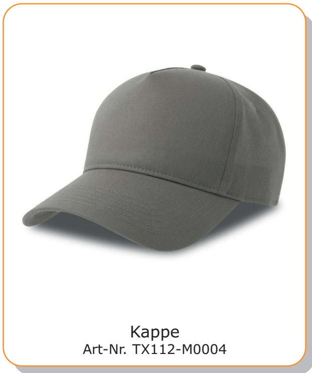
Kappe Art-Nr. TX112-M0004