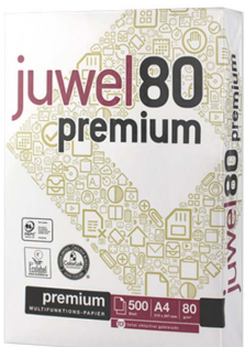
Juwel 80 premium Art-Nr. KP007-40800