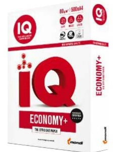
IQ Economy+ Art-Nr. KP008-40800