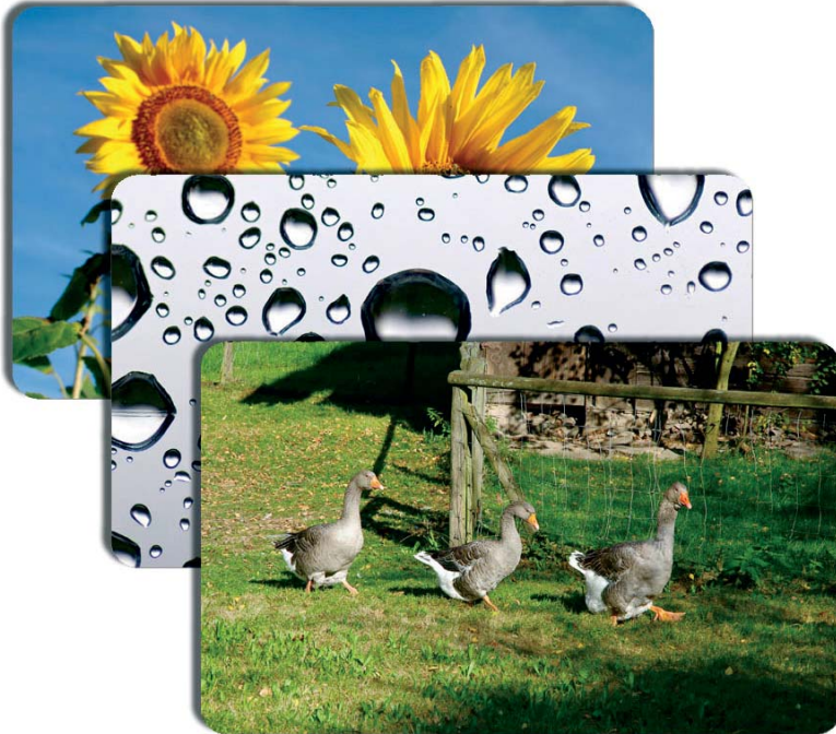
Frühstücksbrettchen Art-Nr. WX200