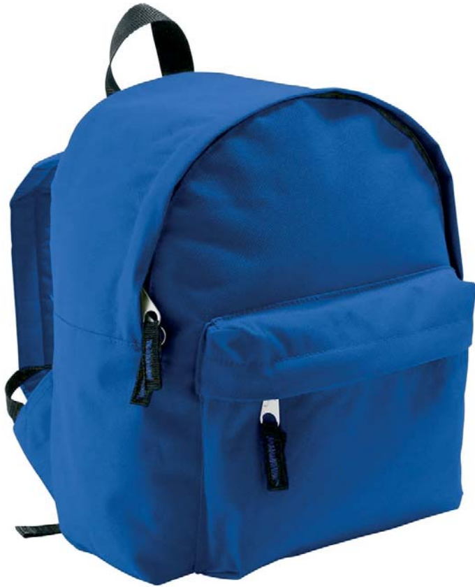
Rucksack Art-Nr. TT700-SO001